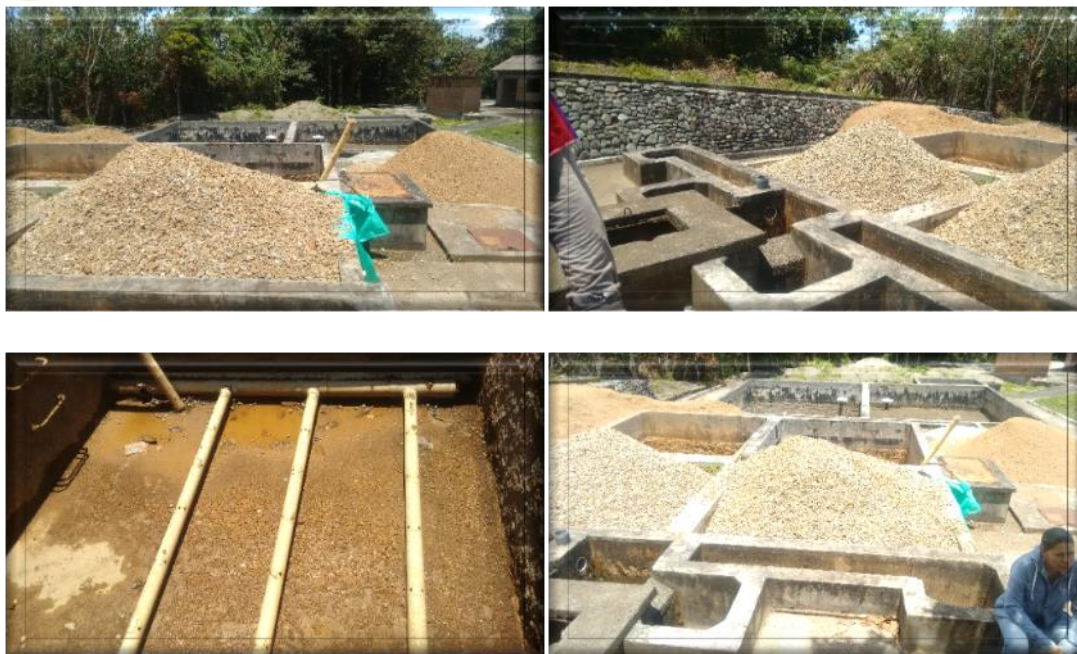
Fotos: Planta de tratamiento Quebrada Grande

Les cobran bimensual a los suscriptores la siguiente tarifa: