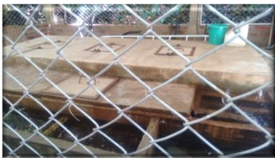
Acueducto de Pajaro de Oro

Se evidenció que aunque no cumplen con el IRCA, actualmente están implementado el plan de mejoramiento, el cual fue aprobado por la UES.