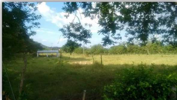
Planta de tratamiento de aguas residuales de San Luis (construida en el año 2012)

Esta planta fue realizada a través del convenio N° 003 del 2011 con la empresas municipales de Tuluá (EMTULUA). Convenio que aún no ha sido liquidado.