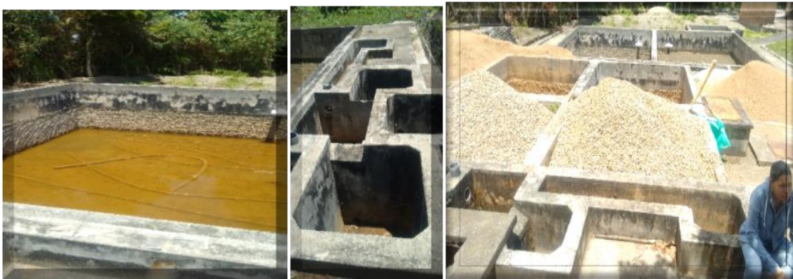
Fotos: Planta de tratamiento Quebrada Grande

Presentado deficiencias en la aplicación del Artículo 15 de la Resolución 2115 del 2007, la cual establece que cuando el agua no es apta para el consumo humano, debe haber gestión directa de acuerdo a su competencia de la persona prestadora, alcaldes y gobernadores.