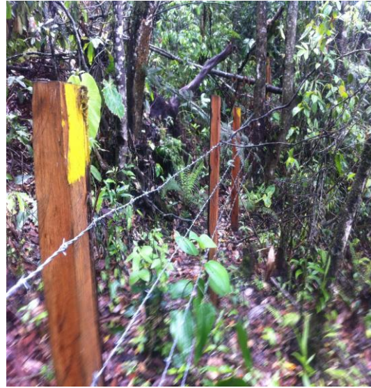
Prédio asilado sin madera inmunizada