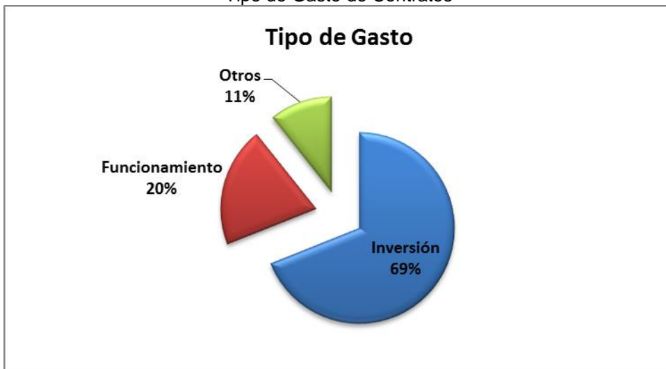
Grafico No. 3 Tipo de Gasto de Contratos

Fuente: Sistema de Rendición de Cuentas en Línea –RCL Elaboró: Dirección Técnica de Infraestructura Física