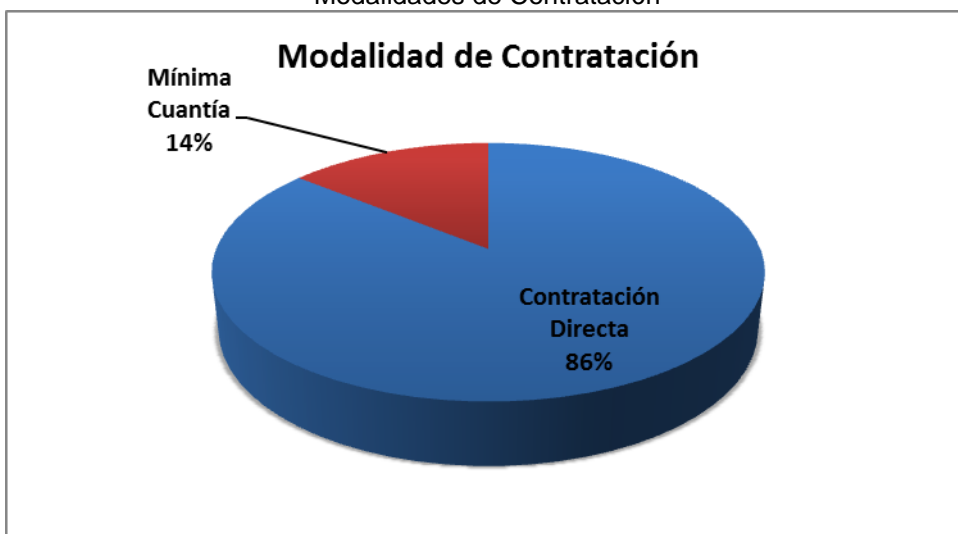
Grafico No. 1 Modalidades de Contratación

Fuente: Sistema de Rendición de Cuentas en Línea –RCL Elaboró: Dirección Técnica de Infraestructura Física