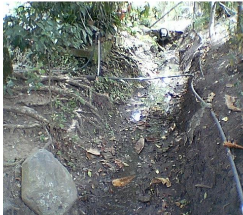
Aguas residuales directamente arrojadas a los cuerpos de agua sin tratamiento alguno

Se evidenció que varios de los pozos sépticos construidos y que no están funcionando, la comunidad los utilizan como botaderos de basuras, incrementando con esto los focos de contaminación y propagación de vectores tales como: roedores, criaderos de moscas, cucarachas y zancudos, perjudiciales para la salud de la comunidad que habitan en estas zonas y en especial la población infantil y el adulto mayor, quienes se han visto expuestos a enfermedades como dengue, fiebres, alergias en la piel, debido a la disposición de estas basuras en estos sitios que no son los adecuados.