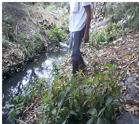
Pozos sépticos contruidos en canales de aguas lluvias y zanjones sin mantenimiento

En otras viviendas se pudo observar, que las aguas residuales tratadas en los pozos sépticos, pero sin pos-tratamiento mediante campos de infiltración, son dirigidas a canales o pequeños zanjones, estructuras que no evidencian mantenimiento periódico presentando taponamiento debido al material sólido que arrastran y en época invernal causan represamiento y como consecuencia de esto pueden generar inundaciones a las viviendas aledañas a los canales.