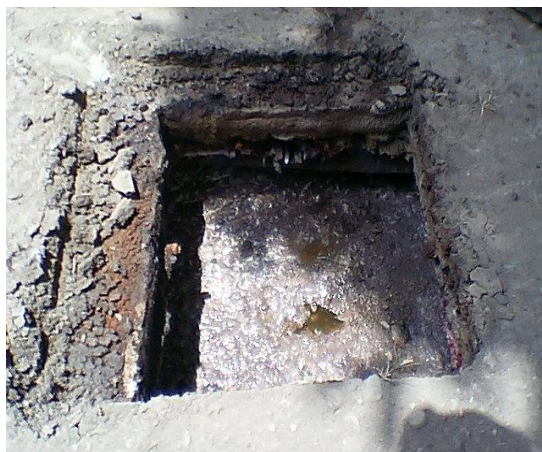
Pozos sépticos colmatados sin Mantenimiento alguno.