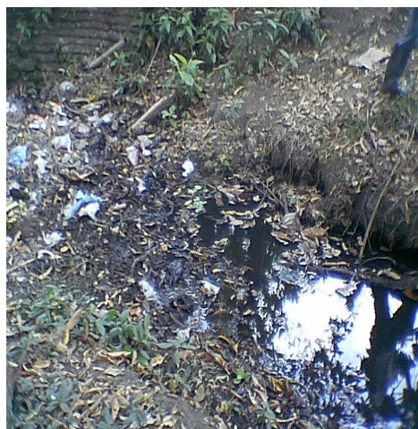
Pozos sépticos utilizados como basureros y zanjones de agua contaminados con basuras