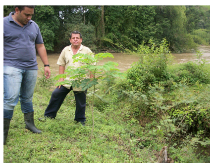
Predio la Hoya donde fue evidente la recuperación ambiental del terreno