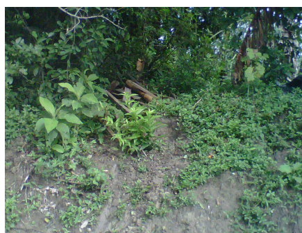
Lagunas de oxidación corregimiento de Zaragoza, y plántulas sembradas para mitigar olores